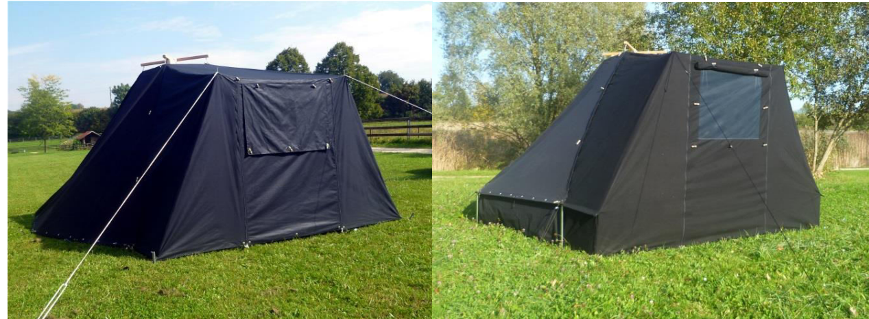
Vorbau-Kohtenblatt S 00/52 und 20/53