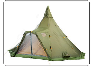
Varanger Camp Eingang mit Mückennetz