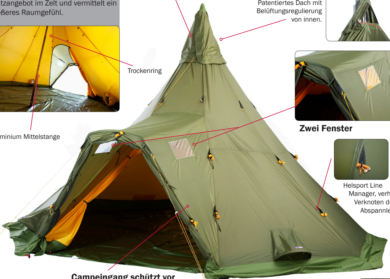
Campeingang schützt vor Wind und Regen