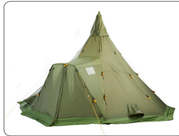
Varanger Camp Eingang geschlossen

Seit vielen Jahren ist das Varanger unser Bestseller unter den Lavas. Für 2010 haben wir das Varanger Camp entwickelt. Diese Variante basiert auf dem erfolgreichen Varanger 8-10 und wurde durch einen nach außen aufgesetzten Eingang erweitert. Der Eingangsbereich ist somit vor Wind und Regen geschützt und ermöglicht ein komfortables Hineingehen ins Zelt. Der Eingang hat zwei seitliche Fenster, die von innen verschlossen werden können. Der nach außen verlagerte Eingang, vergrößert zudem das Platzangebot im Zelt und vermittelt ein größeres Raumgefühl.