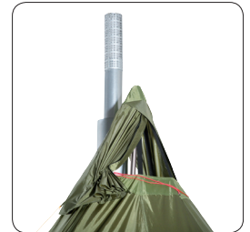
Patentiertes Dach mit Belüftungsregulierung von innen.